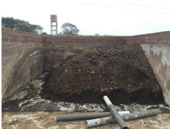
13.11.15 – Kontrolle (links) – Penergetic (rechts)